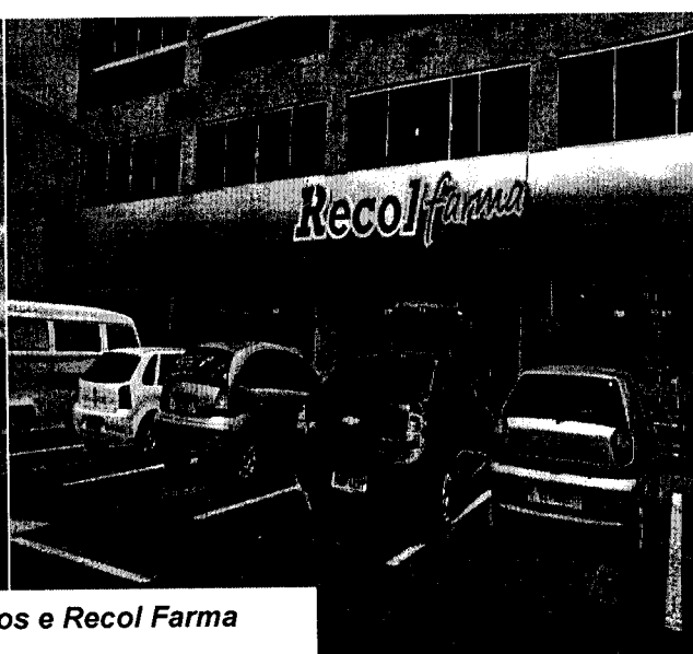
Recol Veiculos e Recol Farma